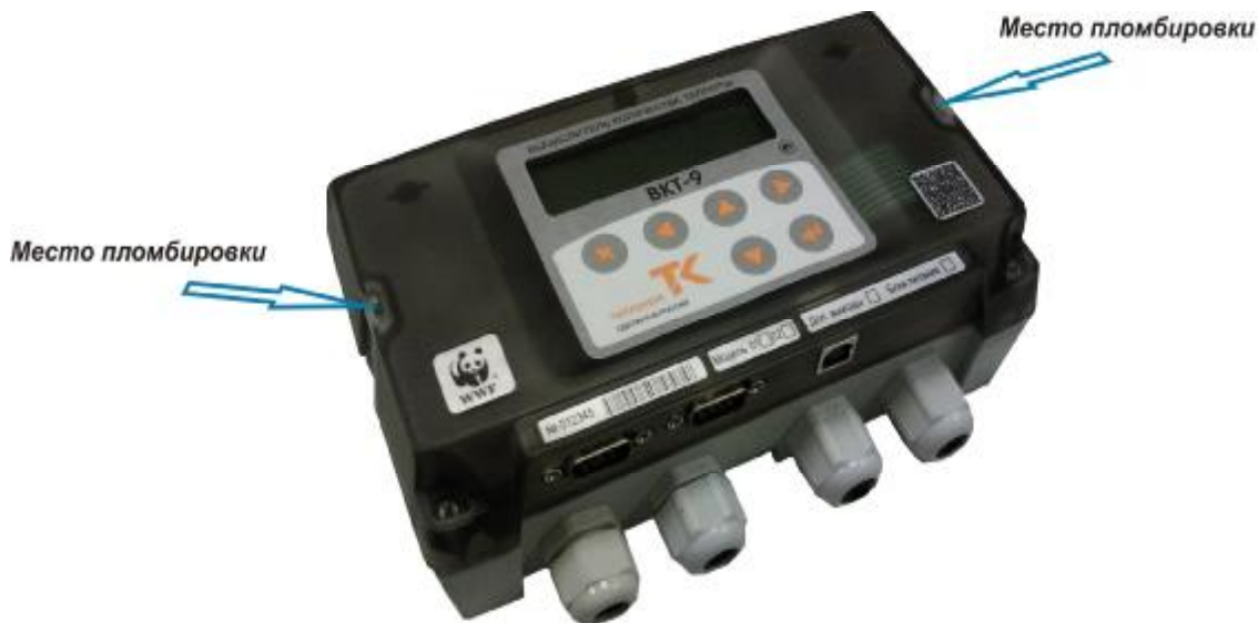
Рисунок 1 – Внешний вид вычислителя

Внешний вид вычислителя приведен на рисунке 1.