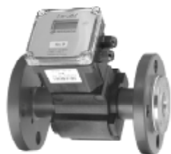
Рисунок 1 – Внешний вид преобразователей с ЭБ исполнения 1