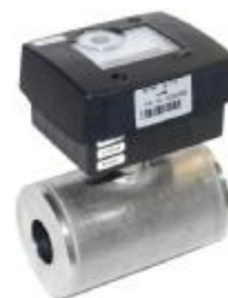
Рисунок 2 – Внешний вид преобразователей с ЭБ исполнения 2