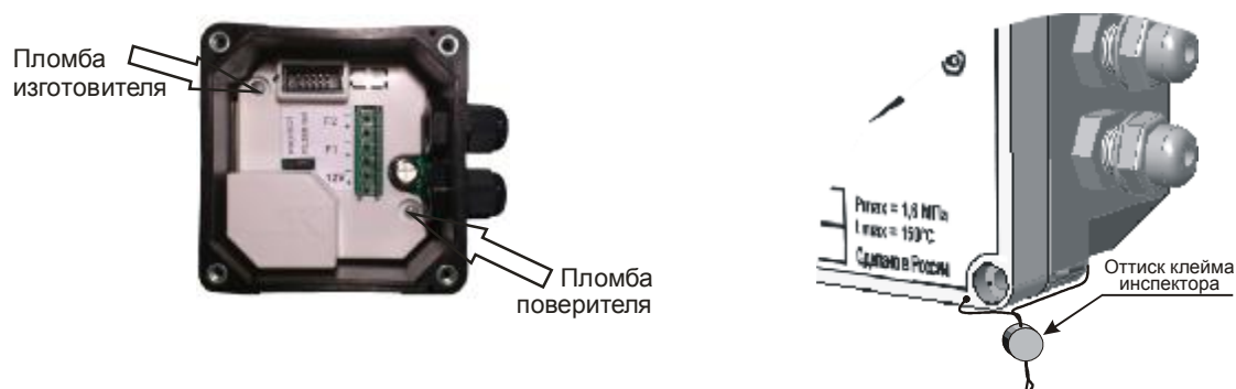
Рисунок 4 – Места пломбирования ЭБ исполнения 1

В целях предотвращения доступа к узлам регулировки и настройки, а также к элементам конструкции, предусмотрены места пломбирования, указанные на рисунках 4 и 5.